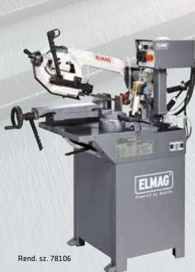
Rend. sz. 78106