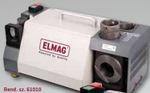
Rend. sz. 61010