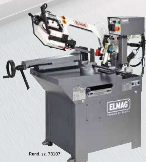
Rend. sz. 78107