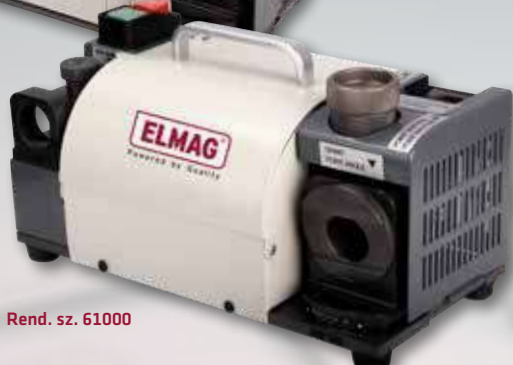
Rend. sz. 61000