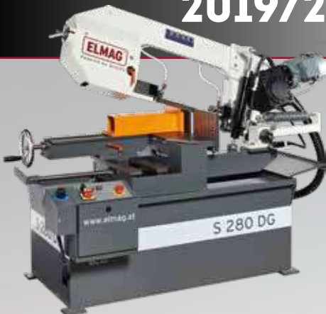
BAUER S 280 DG Rend. sz. 78609