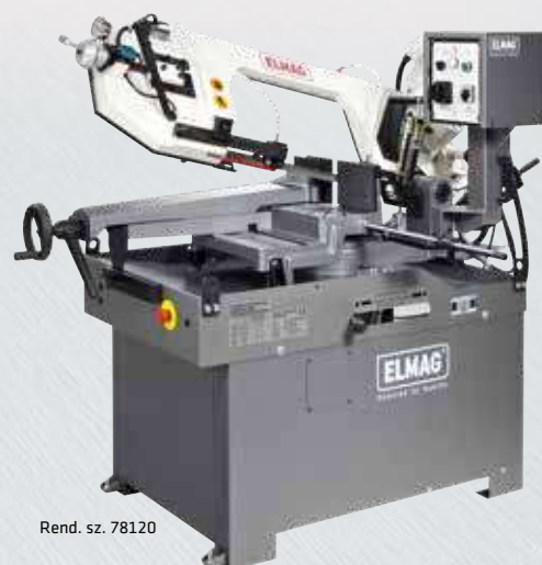
Rend. sz. 78120