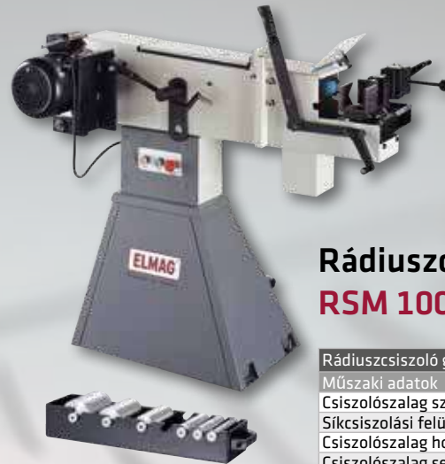
RSM 100x2000 Rend. sz. 82193